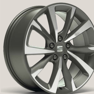
Performance FR PUK