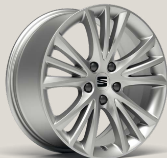
Dynamic St PUA