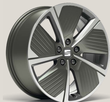
Performance Aero FR P8R

Reference R Style (Business Intense) St FR (Business Intense, PHEV) FR