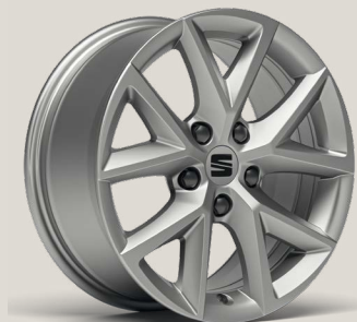
Urban R St