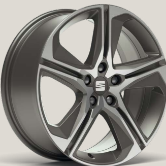
Performance 2 FR PUN